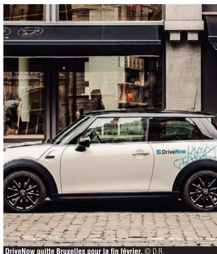
DriveNow quitte Bruxelles pour la fin février.