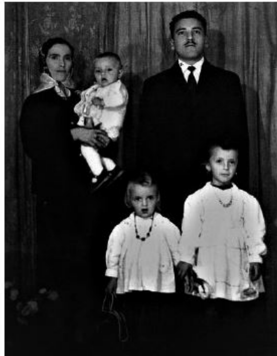
Cette photo de famille a été prise dans un camp de réfugiés en Italie. Le regard de mon père semble pointé vers les Etats-Unis...

A 12 ans, je m'ennuyais. J'étais le dernier d'une fratrie de cinq enfants, plutôt en retrait, mélancolique, timide. Un jour, ma grande sœur Shyret m'a emmené dans une bouquinerie à la Place des Martyrs. C'était une surprise car