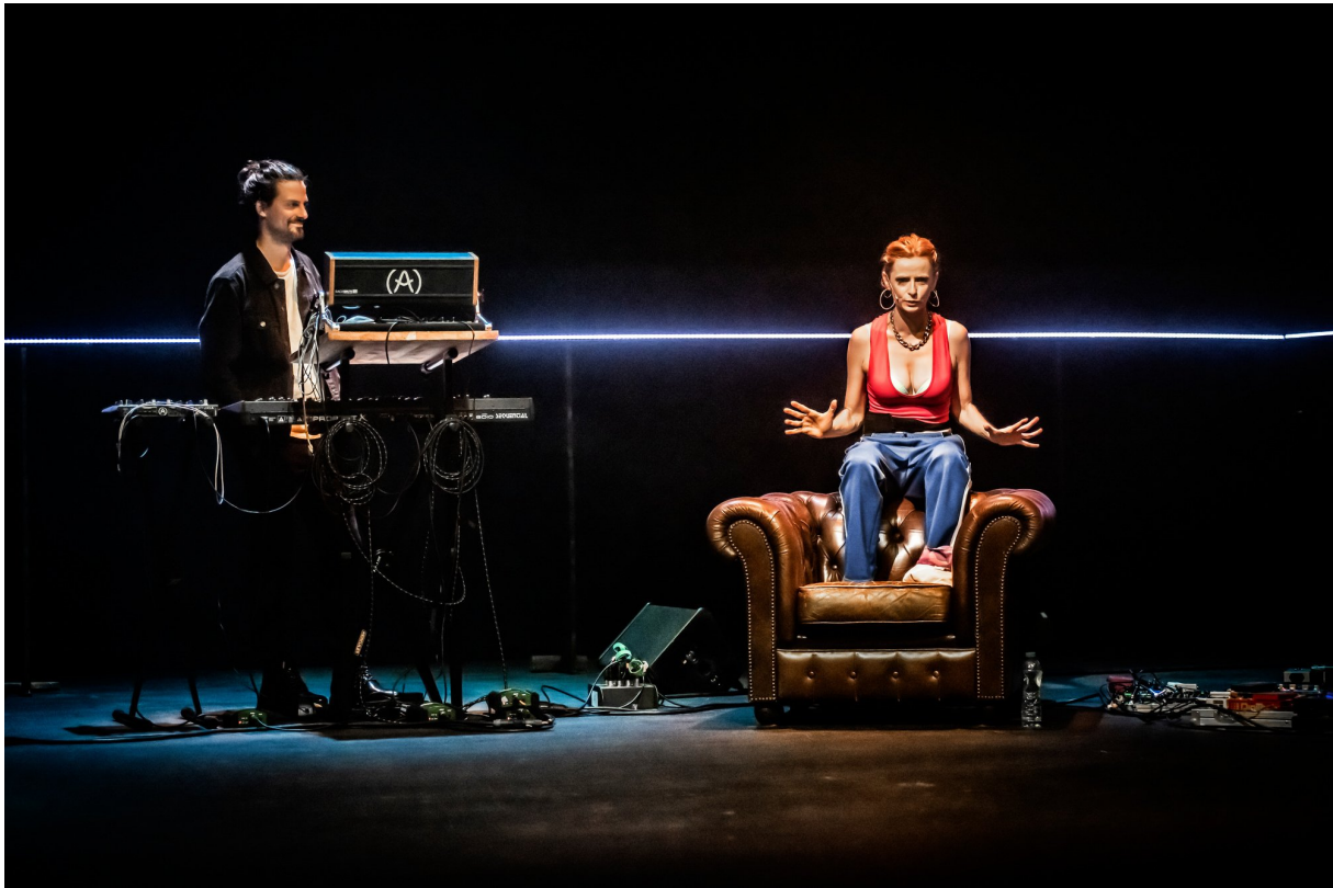
Iphigénie à Splott: Jusqu'au 2 octobre au Théâtre de Poche à Bruxelles

bien dans la rue en survêt face à tous ceux qui oseraient la regarder de travers, que dans les bars, en tenue bien échantée et push up bra, face à tous ceux qui lui taperaient dans l'oeil, quoi qu'en dise son blaireau de mec, Kevin.