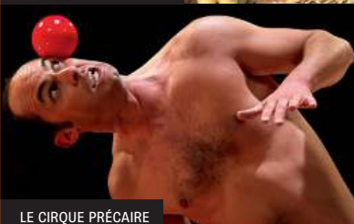
LE CIRQUE PRÉCAIRE