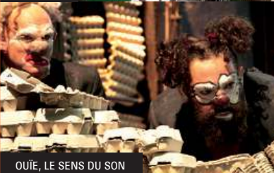
OUIE, LE SENS DU SON