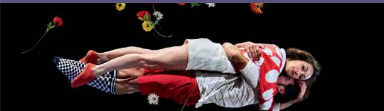
DANS TON CŒUR

LE FESTIVAL CHARLEROI BISARTS FAIT SON GRAND RETOUR APRÈS 3 ANS D'ABSENCE ! UNE 22 ÈME ÉDITION HORS LES MURS AVEC UN VILLAGE DE CHAPITEAUX SUR LE SITE DE L'ANCIEN HÔPITAL CIVIL. UN ESPACE PEUPLÉ DE TOILES, DE LUMIÈRES ET D'AUTRES STRUCTURES INSOLITES, À DEUX PAS DES ÉCURIES ET DU PBA QUI SERONT AUSSI DE LA FÊTE. AU PROGRAMME : DU CIRQUE, DU THÉÂTRE, DE LA DANSE, DE L'INATTENDU ET DE L'EXCEPTIONNEL !