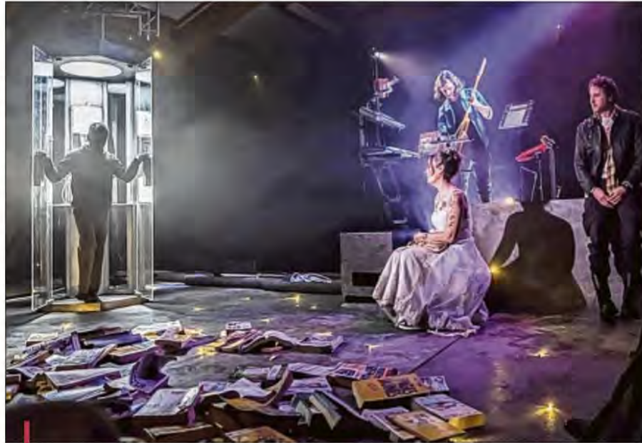
"Allosaurus (même rue même cabine)" de Jean-Christophe Dollé, à voir au 11. Avignon jusqu'au 29 juillet.

Dans Allosaurus , tout y est vu de manière originale, im-