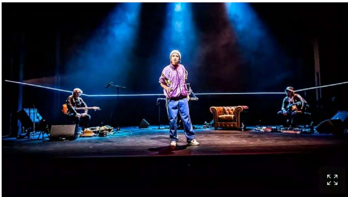
«Iphigénie à Splott» de Gary Owen. DEBBY TERMONIA