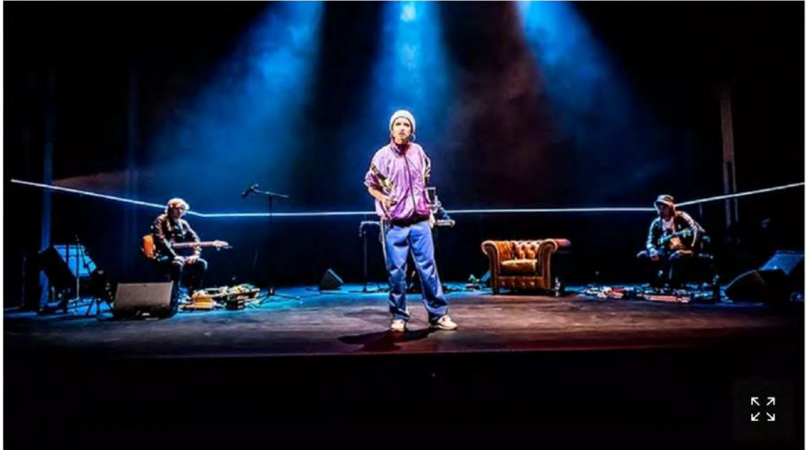
«Iphigénie à Splott» de Gary Owen. DEBBY TERMONIA